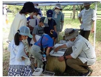
施設公開・希少野生植物観察会の様子