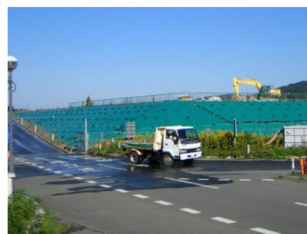
嵩上げ工事の実施状況（高さ約5m）