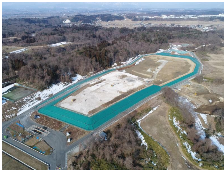
嵩上げ工事の実施状況（全景）