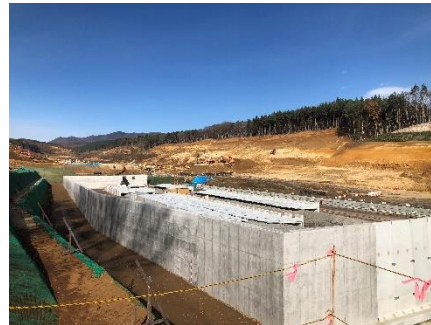
右岸側 擁壁構築完了