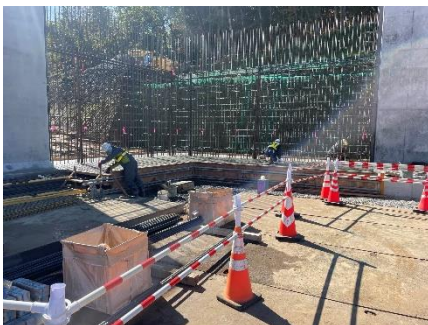
擁壁構築状況（施工中）