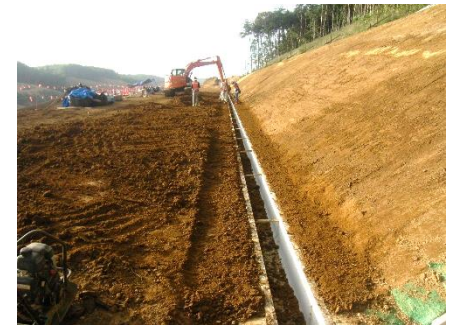
小段排水施工状況（施工中）